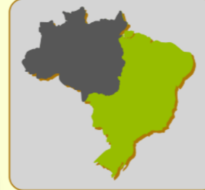
Localização da bacia: