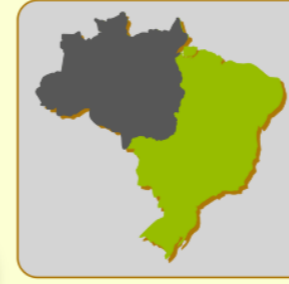
Localização da bacia: