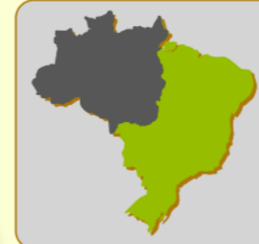
Localização da bacia: