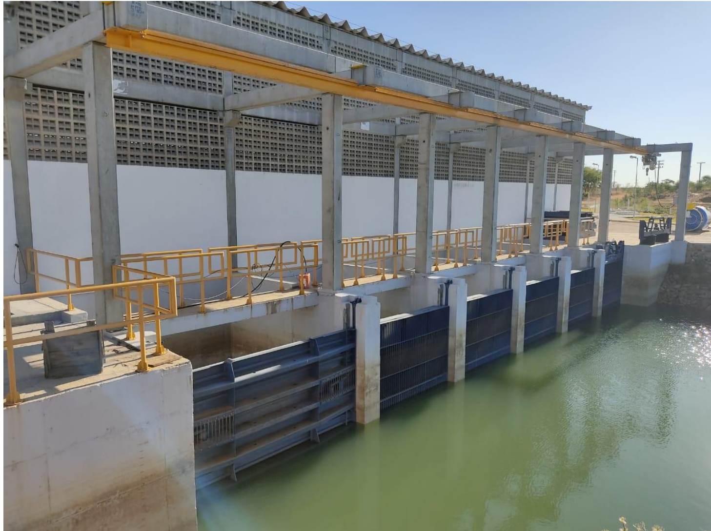
Moxotó (Compesa) Atendimento: Permanente Vazão Estimada: 0,3 m 3 /s Coord. UTM – SIRGAS 2000: E-671615 / N-9101539