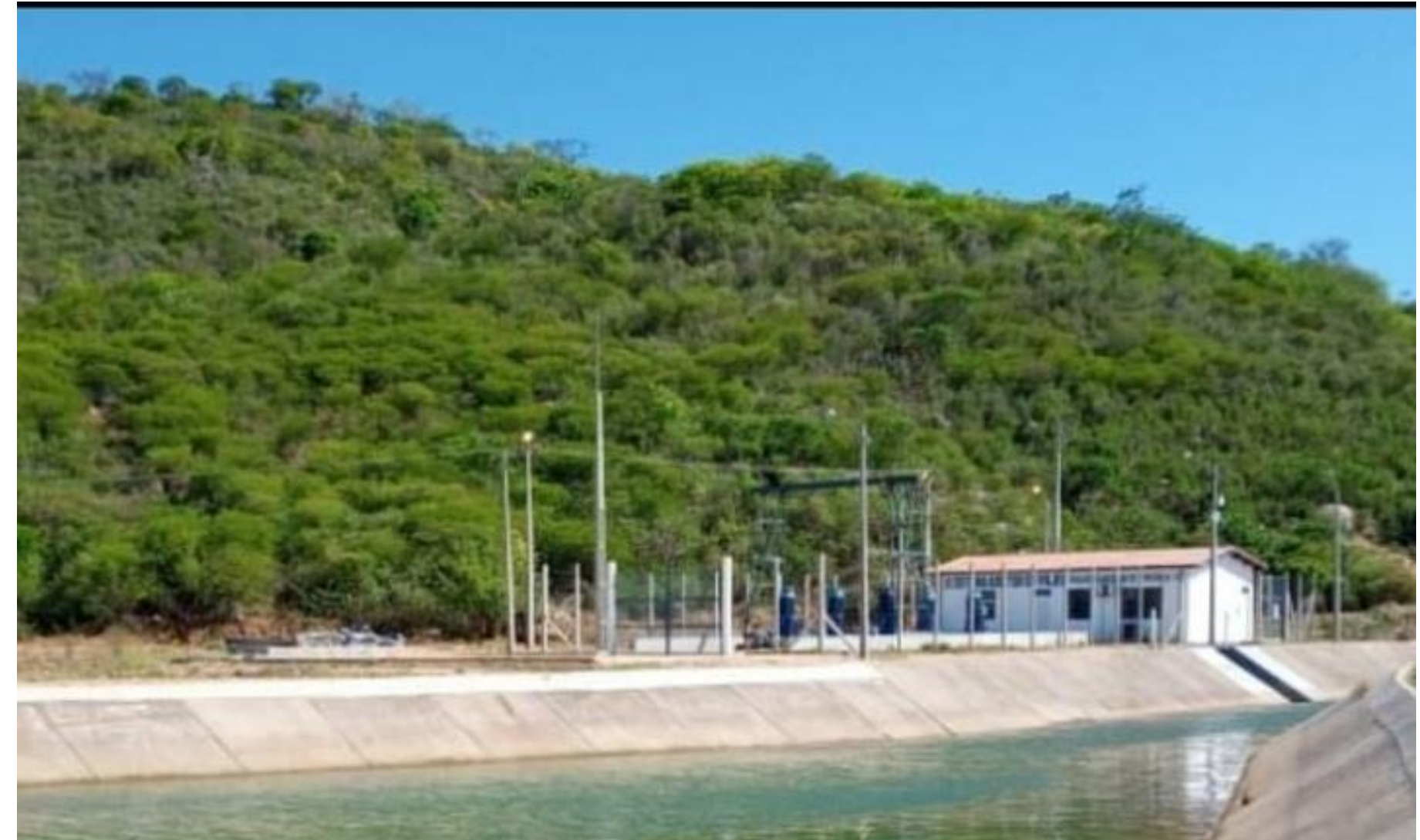
Pajeú (Compesa) Atendimento: Permanente Vazão calculada : 0,3 m 3 /s Coord. UTM – SIRGAS 2000: E-681353 / N-9108472