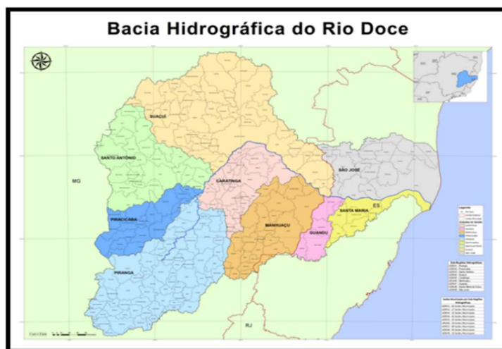
Figura 03 – Bacia Hidrográfica do Rio Doce

A figura 03 apresenta a Bacia Hidrográfica do Rio Doce e os respectivos comitês de bacia tanto do Estado de Minas Gerais como do Estado do Espírito Santo.