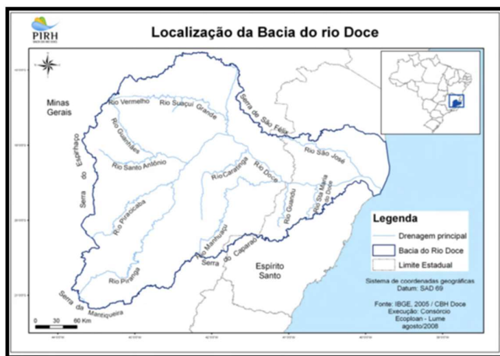
Figura 02 – Localização da Bacia Hidrográfica do Rio Doce

aproximadamente 850 km, até atingir o oceano Atlântico, junto ao povoado de Regência, no Estado do Espírito Santo, como mostrado na figura 02.