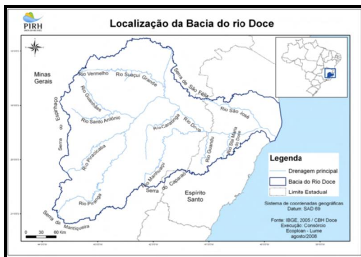
Figura 02 – Localização da Bacia Hidrográfica do Rio Doce

aproximadamente 850 km, até atingir o oceano Atlântico, junto ao povoado de Regência, no Estado do Espírito Santo, como mostrado na figura 02.