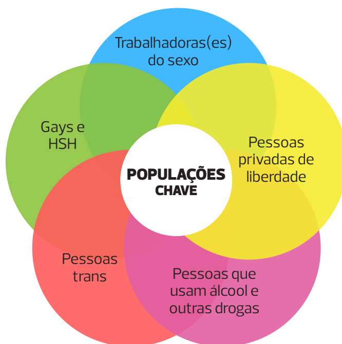
Figura 4 – As populações-chave

As Figuras 6 e 7, a seguir, representam as populações-chave e prioritárias para o HIV e hepatites B e C, conforme descrito acima: