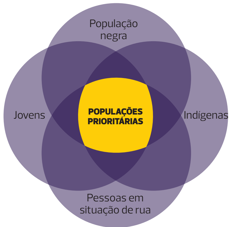
Figura 5 – As populações prioritárias