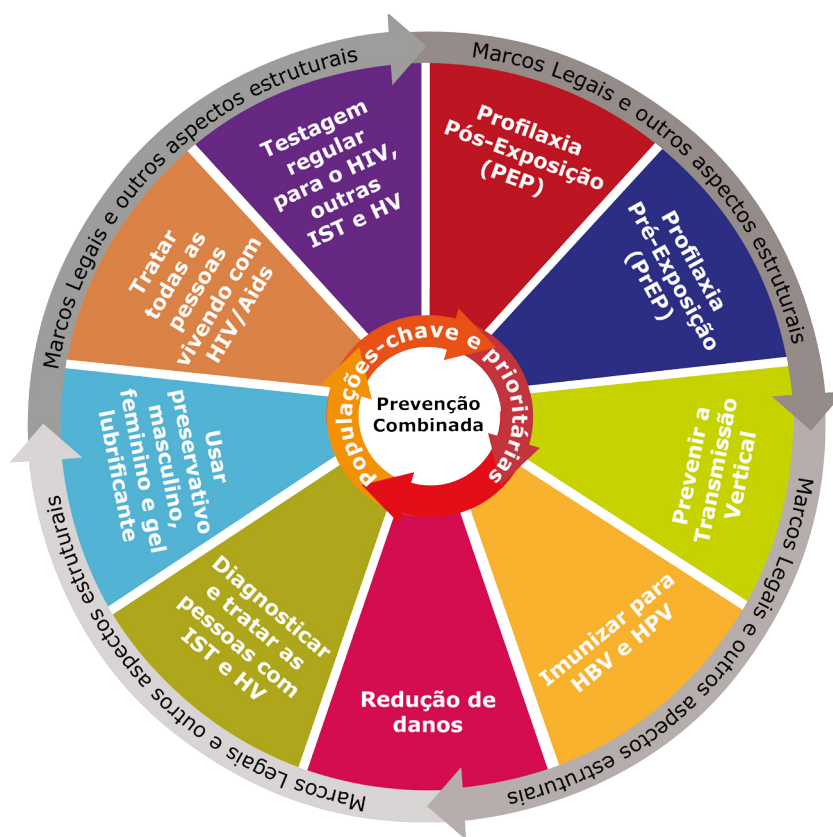
Figura 3 – Mandala de Prevenção Combinada do HIV

O símbolo da mandala (Figura 3) representa a combinação de algumas das diferentes estratégias de prevenção (biomédicas, comportamentais e estruturais), pois apresenta a ideia de movimento em relação às possibilidades de prevenção, tendo as intervenções estruturais (marcos legais) como base dessa conjugação.