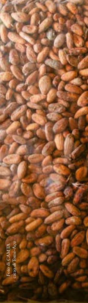
Foto di CAMITA cacao di Tomé-Açu

al Salone del Cioccolato a Parigi, nella categoria “Cacao d’Eccellenza, Frutta Secca-Sud America”. Sempre in Francia, nel 2015 si è tenuto un concorso per scegliere le migliori fave di cacao del mondo, l’80% dei campioni brasiliani in gara provenivano dalla regione meridionale di Bahia. Il cacao del sud di Bahia è presente nell’immaginario internazionale brasiliano, ad esempio, attraverso la letteratura e le opere di Jorge Amado.