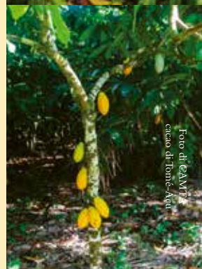
Foto di CAMITA cacao di Tomé-Açu