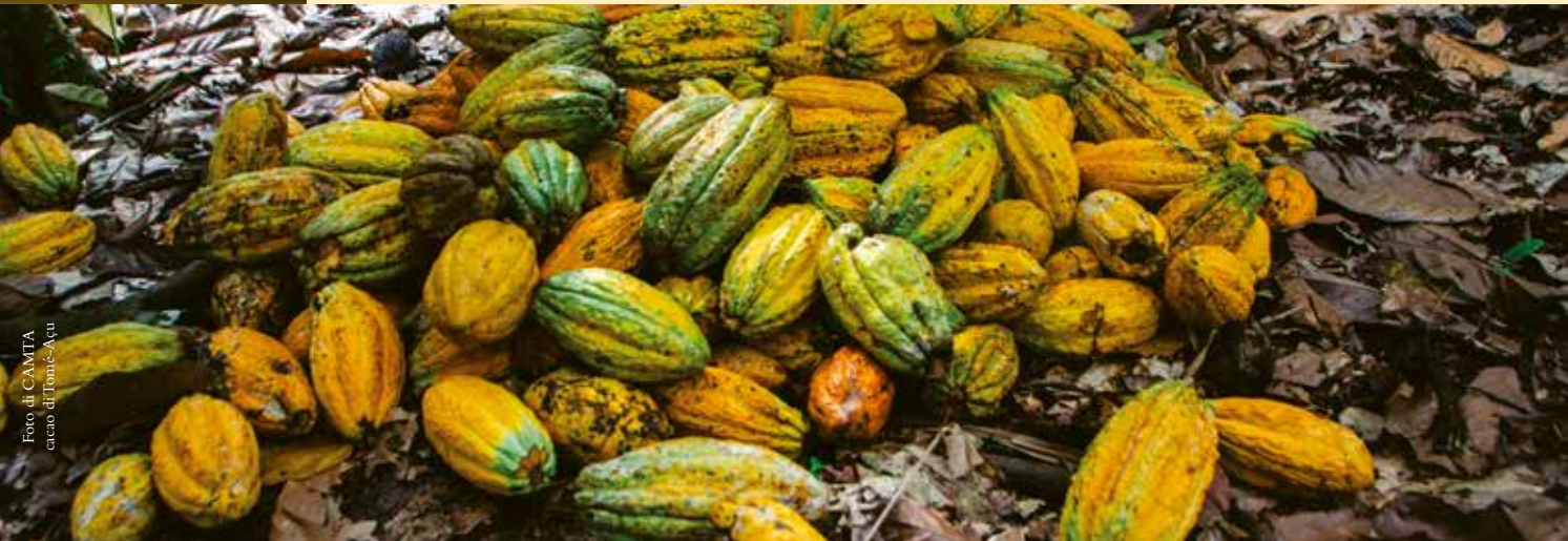
cacao di Tomé-Açu