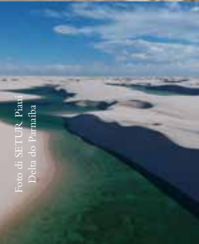
Delta do Parnaíba