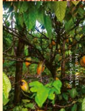
cacao di Tomé-Açu