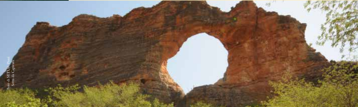
Serra da Capivara