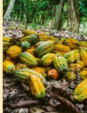
Foto di CAMITA cacao di Tomé-Açu

Per quanto riguarda la fama del cacao del sud di Bahia, nel 2011 era già stato premiato