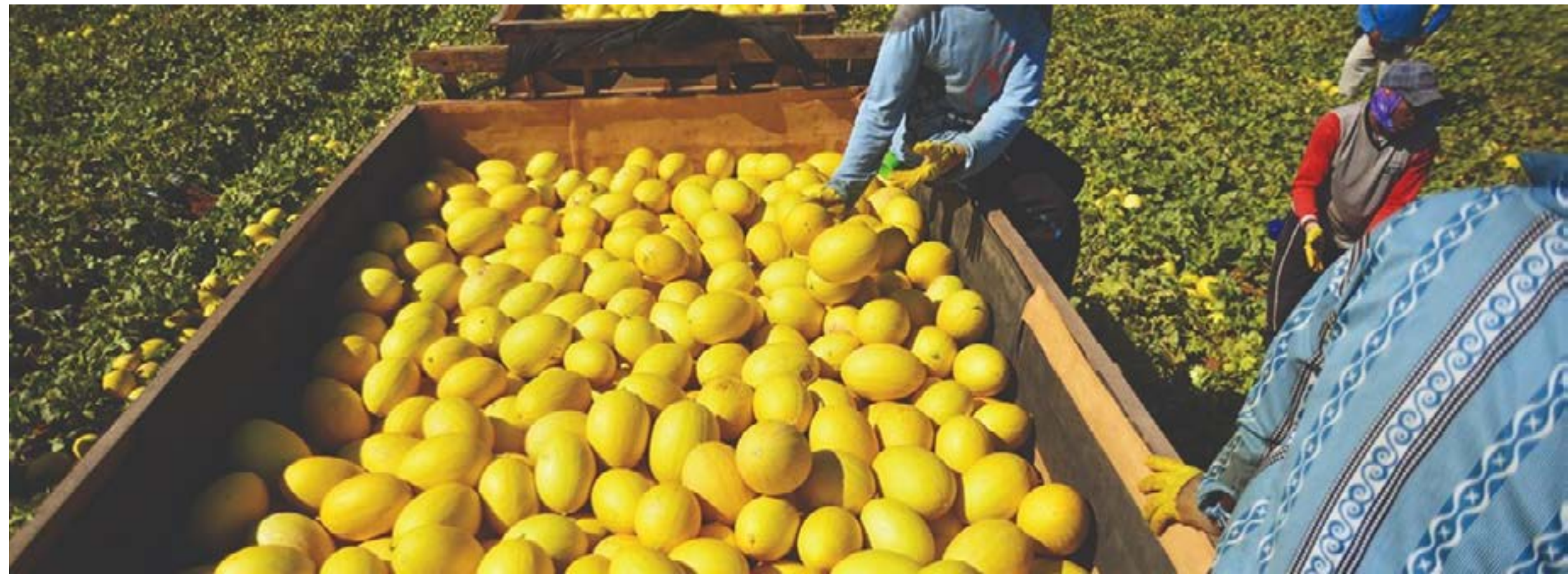
Melão de Mossoró no Rio Grande do Norte, Brasil

No cenário ideal, o controle deve ser estabelecido no Caderno de Especificações Técnicas e no Plano de Controle.