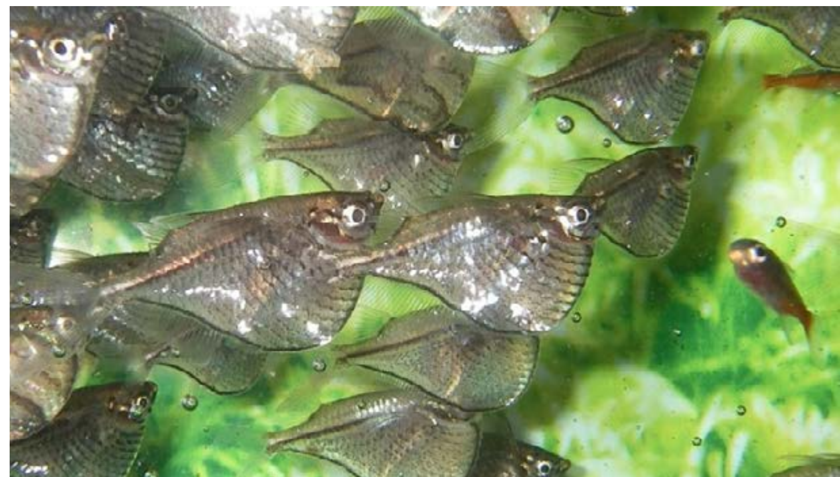
Peixes ornamentais do Rio Negro no Amazonas, Brasil

[1] Caderno de Especificações Técnicas é a nomenclatura usada pela IN INPI nº 95/2018 em substituição ao Regulamento de Uso.