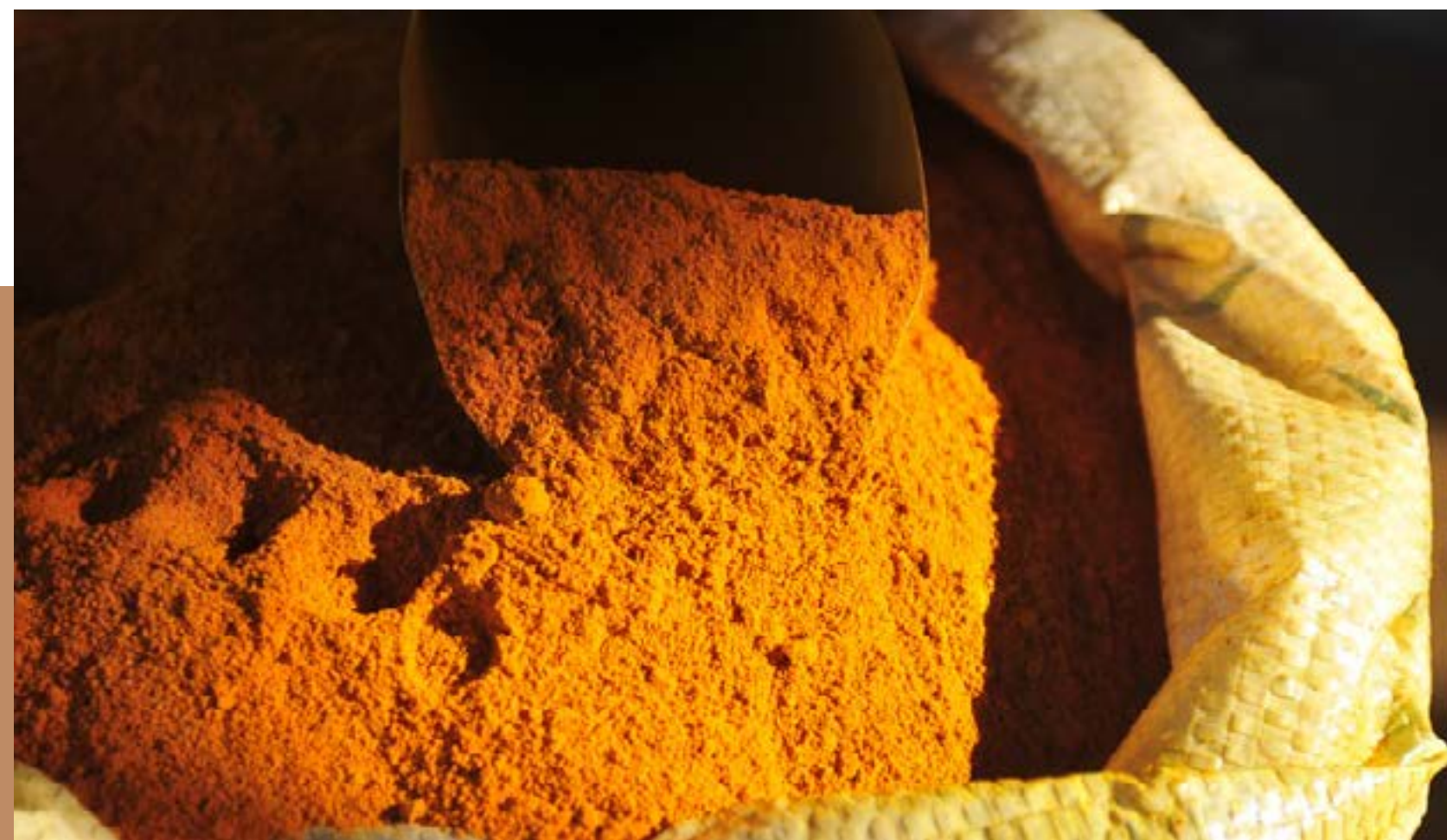
Açafrão da Região de Mara Rosa em Goiás, Brasil

O controle deve ser viável técnica e economicamente, ser transparente, imparcial e coerente, contar com pessoal treinado e com recursos necessários para a sua realização.