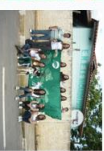
Figura 5. Equipe performando.