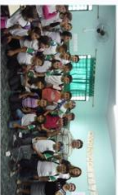
Figura 1. Atividade de socialização Ricardo Puccetti.

Conduziu-se a Escola Municipal de Ensino Infantil e Fundamental Ricardo Puccetti em Capela do Alto (SP) (Fig. 5), e uma atividade educativa sanitária foi proposta em parceria com o Serviço de Saúde Animal do Município de Agricultura, Pecuária e Abastecimento (MAPA) no Estado de São Paulo (SSA/SP), e o Curso de Medicina Veterinária das Faculdades Metropolitanas Unidas. Com a intenção de atingir o objetivo para todos os segmentos da sociedade, elaborou-se estratégias de nove a dez anos de idade para disseminar as informações sobre a raiva, a vacinação das animais e as medidas de alerta e prevenção da doença. A atividade contou com uma apresentação monodisciplinar de responsabilidade do SSAU/ MAPA. Foi elaborado, pelos estudantes da FMU, um texto para teatro de bonecos, em que os mesmos encenaram. Os personagens do teatro foram caracterizados de maneira que as crianças pudessem memorizar e recordar das informações a serem disseminadas no seu meio social (Fig 2).