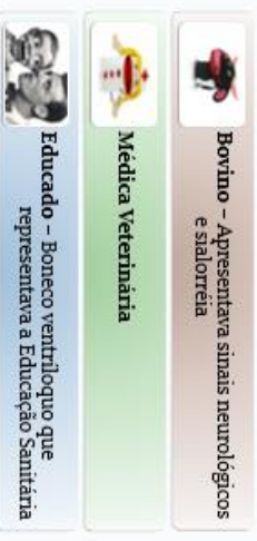
Figura 2. Caracterização de alguns personagens do teatro de bonecos.