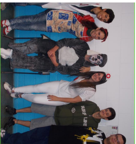
Teatro com personagens temáticos