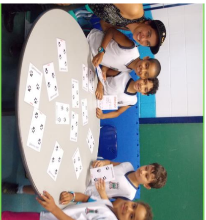
Jogo do certo e errado