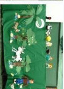
Figura 4. Apresentação do teatro de bonecos durante atividade educativa.