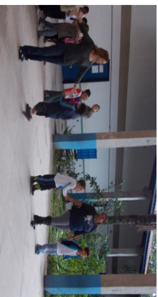
Gincana corre e bate