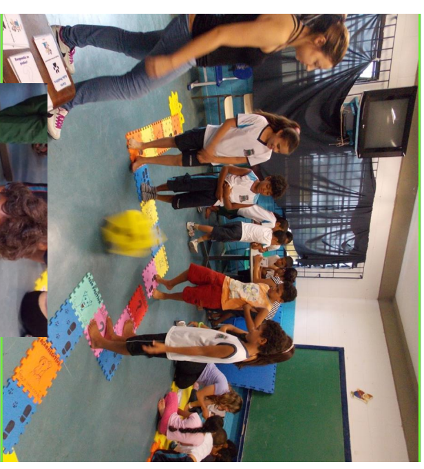
Jogo do tabuleiro