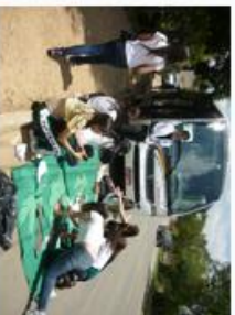
Figura 3. Montagem do cenário.