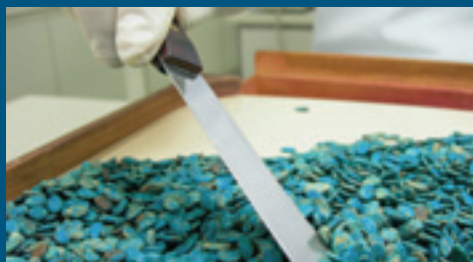
Análise de sementes tratadas