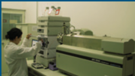
Cromatógrafo líquido acoplado a espectrômetro de massa em tandem – IC MS MS

Este conjunto de laboratórios, gerenciado pela Coordenação Geral de Apoio Laboratorial – CGAL, desenvolve ações que visam garantir a sanidade animal e vegetal e a segurança dos alimentos que chegam à mesa de milhões de consumidores no Brasil e no mundo.