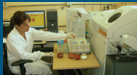
Espectrômetro de massa com plasma acoplado