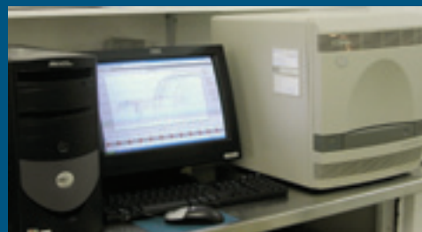
Termociclador para PCR em tempo real