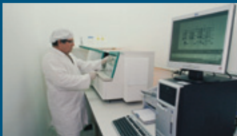
Ribotipagem de cepas de patógenos