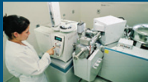
Cromatógrafo gasoso de alta resolução acoplado a espectrômetro de massa de alta resolução GC - HRMS