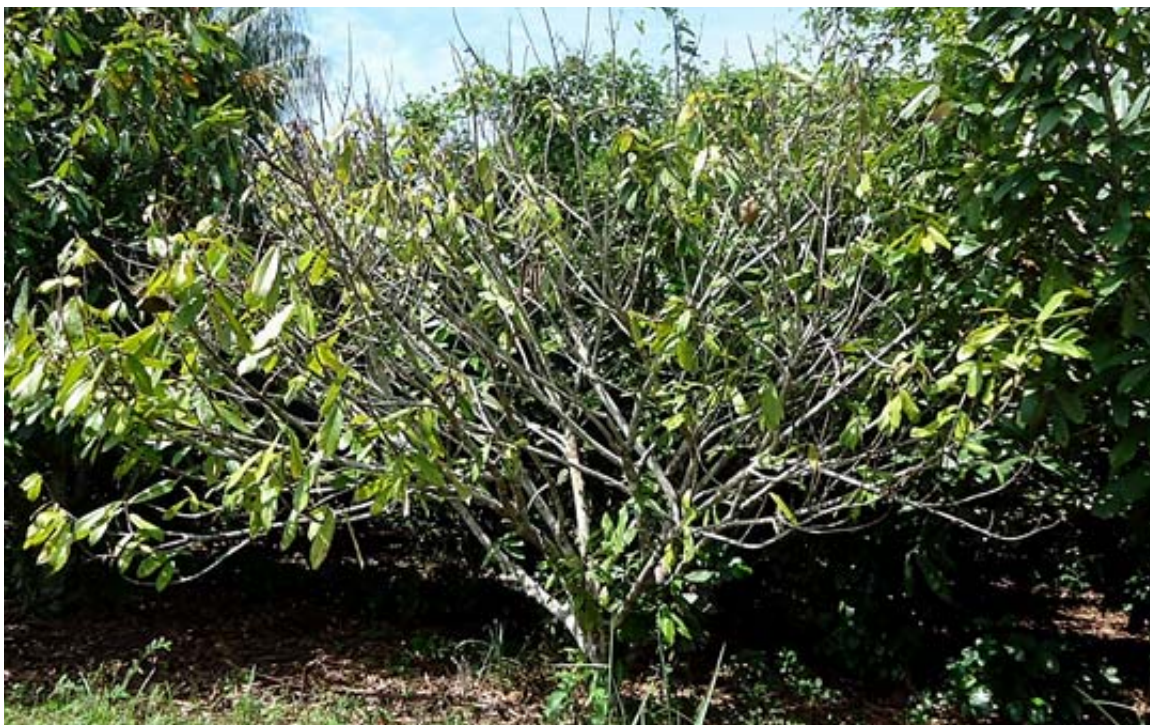
Figura 1. Aspecto de cupuaçuzeiro infestado por coleótero xilófago, em Nova Califórnia, RO. (Crédito da foto: Amauri Siviero).