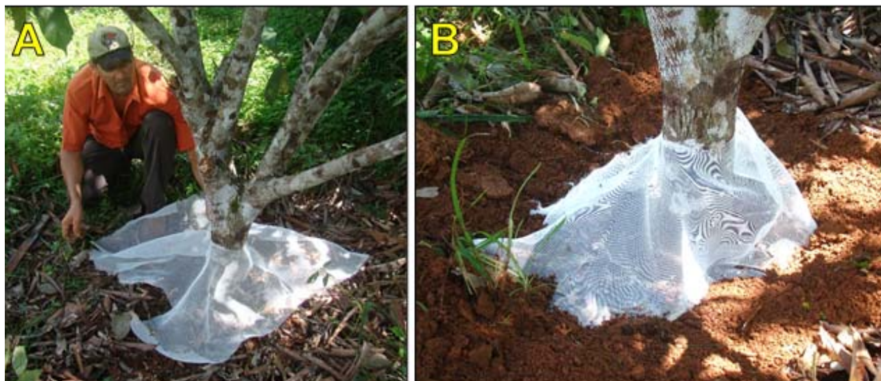
Figura 3. (A) Acomodação de tecido tipo "voil" no colo de cupuaçuzeiro atacado por buprestídeo. (B) Aspecto da armadilha após a instalação.

comprimento para Euchroma gigantea (L.), até poucos milímetros de comprimento, para espécies minadoras de folhas (Costa Lima, 1953). Segundo Iannuzzi, Maia e Vasconcelos (2006), a família Buprestidae é geralmente negligenciada em levantamentos faunísticos, embora possua representantes reconhecidamente considerados importantes pragas agrícolas.