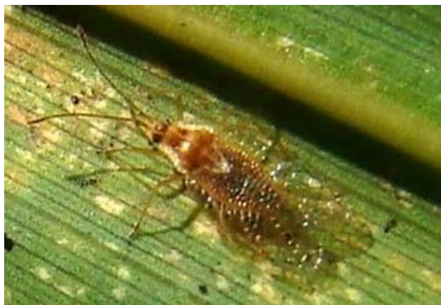
Figura 3. Vista dorsal de adulto de Leptodictya sp. (Hemiptera: Tingidae) na face abaxial de folha de Bambusa vulgaris var. vittata . (Crédito da foto: Rodrigo Souza Santos).

podendo evoluir para necrose do tecido foliar e, no caso de infestações severas, senescência das plantas (Bellotti, 2002; Farias e Alves, 2004; Guidoti et al., 2014). A importância econômica desses insetos tenderá a aumentar, especialmente pela emigração de espécies (transportadas na fase de ovo, principalmente) e à medida que haja expansão de área plantada de culturas hospedeiras (Neal Jr. & Schaefer, 2000).