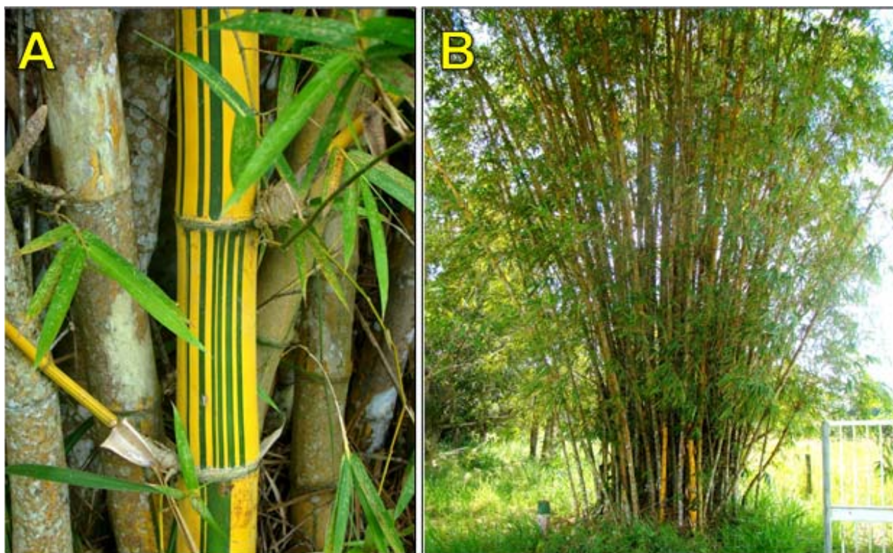
Figura 1. A. Detalhe da coloração do colmo de Bambusa vulgaris var. vittata e B. Touceira de B. vulgaris var. vittata em Brasília, AC.

Bambusa vulgaris var. vittata é uma espécie exótica, popularmente conhecida como “bambu comum”, “bambu-brasileiro”, “bambu-imperial” ou “bambu-gigante-amarelo” (Figuras 1A e 1B). As plantas possuem colmos amarelos e brilhantes com listras verde-escuras, podendo atingir até 20 m de altura. Foi introduzida no Brasil por imigrantes portugueses, apresentando uma boa adaptação em quase todo o território nacional, com maior incidência nos estados de São Paulo, Minas Gerais, Rio de Janeiro e Acre (Salgado et al., 1994; Greco & Cromberg, 2011).