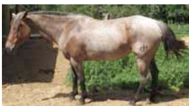
Escore Corporal 4 a 6

Coluna nivelada. Costelas não estão visíveis, mas podem ser facilmente sentidas. Ombros e pescoço conectam-se perfeitamente no corpo.