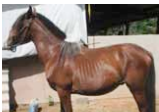
Escore Corporal 1 a 3

Nenhum tecido de gordura. Espinha, base da cauda e costelas proeminentes. Estrutura óssea facilmente visível.