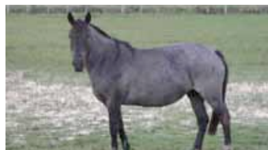
Escore Corporal 7 a 9

Dobras de gordura nas costas. Dificuldade de sentir costelas. Gordura na base da cauda. Espessamento do pescoço e parte interna das coxas.