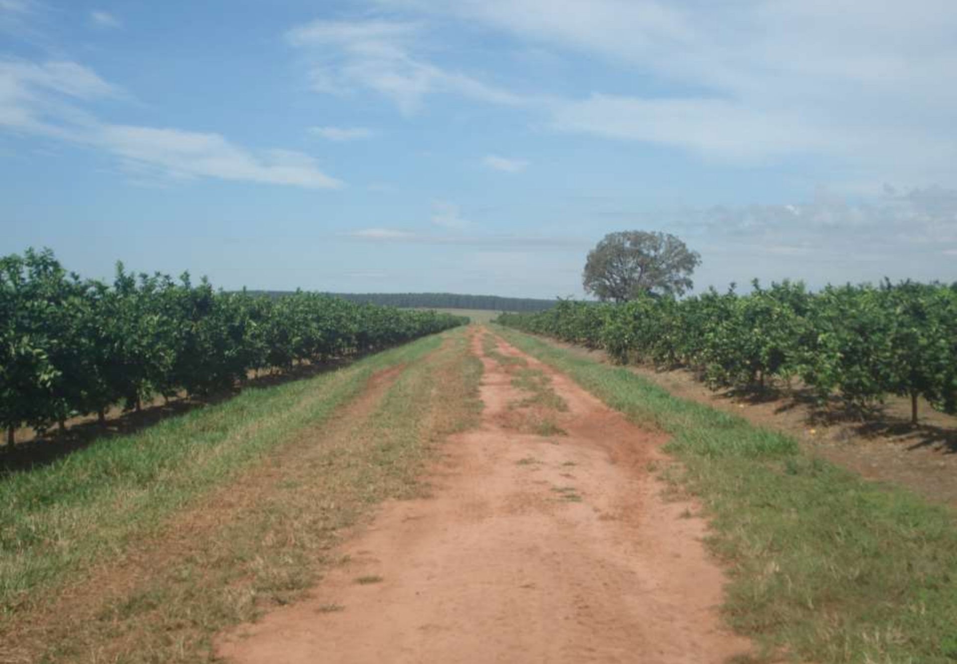
Quadra de laranja Valência Americana: Citrosuco - Fazenda Ventura (Reginópolis - SP), 25 de maio de 2015