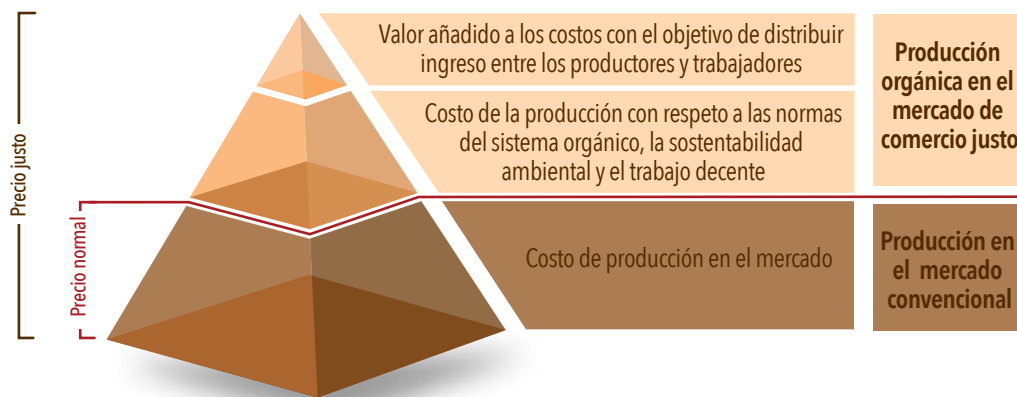
Figura 4: Composición del precio justo en la cadena de producción de la Red Justa Trama .....