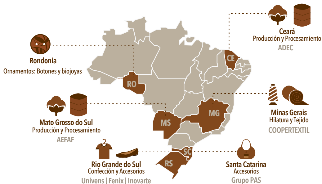
Figura 1: La Red Justa Trama

En la actualidad, la cadena de Justa Trama se distribuye en seis estados brasileños, abarcando varios territorios y contribuyendo al desarrollo local. El punto de partida de la red es en el noreste y centro oeste de Brasil (Ceará y Mato Grosso do Sul), donde agricultores familiares dispersos en decenas de municipios cultivan, cosechan y procesan el algodón agroecológico, sin el uso de insumos químicos, con técnicas de conservación del suelo y del agua y utilizando el control biológico de plagas y enfermedades del algodón. Después del desmote, la fibra del algodón sigue a Minas Gerais, en la región sureste, dónde se hace el hilado y el tejido. El tejido sigue de allí hacia el sur del país, dónde se realiza la confección con la marca Justa Trama, en Rio Grande do Sul, utilizando complementos de piezas de telar de Santa Catarina. El producto final (ropas, zapatos, juguetes y bolsos) recibe adornos hechos en el Estado de Rondonia, en la región norte del país, a partir de semillas naturales y materiales sostenibles de la foresta amazónica. Al final, la Cooperativa Central de Justa Trama, que también se ubica en Rio Grande do Sul, comercializa las piezas directamente al consumidor.