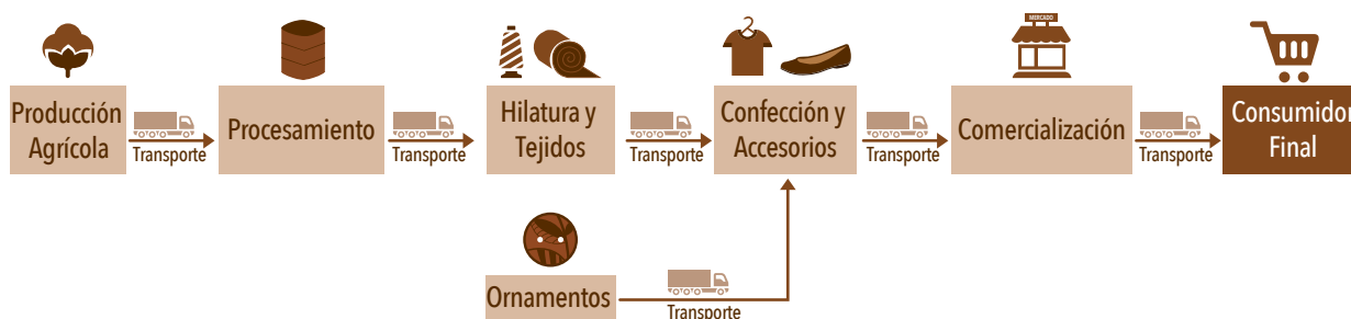
Figura 5: La cadena de producción conjunta de la Red Justa Trama

Para ello, la gestión de la cadena debe partir de una visión sistémica que sobrepase la comprensión segmentada por eslabones, y que permita, además, que cada actor entienda cómo su actuar afecta a la red en su conjunto. La perspectiva de procesos interrelacionados es otro factor importante. Los emprendimientos deben mantener relaciones de apoyo entre sí, tratando de desarrollar todos los eslabones y no sólo a sí mismos.