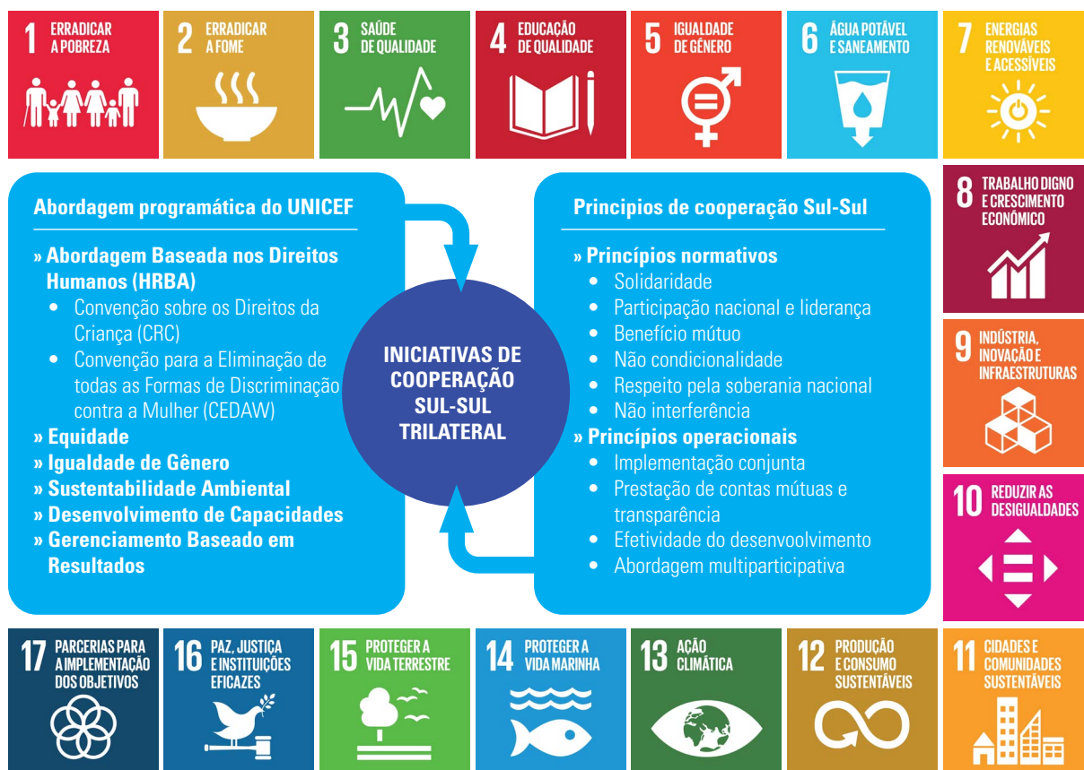
Figura 1: Quadro normativo e operacional de referência da Cooperação Trilateral Brasil-UNICEF

Reunidos, estes princípios e enfoques comuns compõem o quadro normativo e operacional de referência que guia o desenvolvimento das parcerias de CSST a cada estágio do processo, do planejamento à avaliação. A figura 1, abaixo, mostra como este quadro está alinhado a parceria de CSST Brasil-UNICEF e dentro da Agenda 2030.